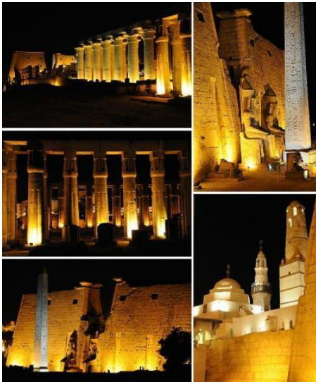
ライトアップされたルクソール神殿

ルクソール東岸のハイライトは、何とんでもカルナック神殿とルクソール神殿。カルナック神殿の列柱室は、アガサ・クリスティの「ナイル・殺人事件」の映画で有名になった。