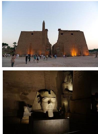
ルクソール神殿夕景とラムセス2世像

ルクソール神殿は、かつてカルナック神殿と参道で結ばれていた。夜のライトアップされた神殿は幻想的で、ところどころにラムセス2世の彫像がある。2本あったオベリスクの片方は持ち出され、パリのコンコルド広場に立つ。