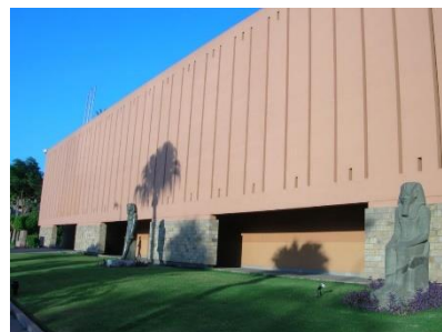
ルクソール博物館外観

ルクソール博物館の優れたコレクションは、ルクソール近辺から発掘された比較的保存状態の良い遺物・遺跡。規模ではカイロに及ばないが、わかりやすい展示で、ぜひ見てみたい博物館だ。